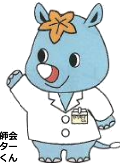
広島県薬剤師会 マスコットキャラクター ヤクザイクン