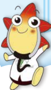
広島県医師会 イメージキャラクター もみじ医