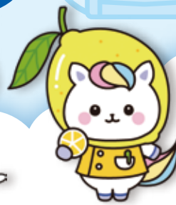
広島県看護協会 「看護の日」キャラクター かんごちゃん (広島県バージョン)