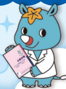
広島県薬剤師会 マスコットキャラクター ヤクザイクン